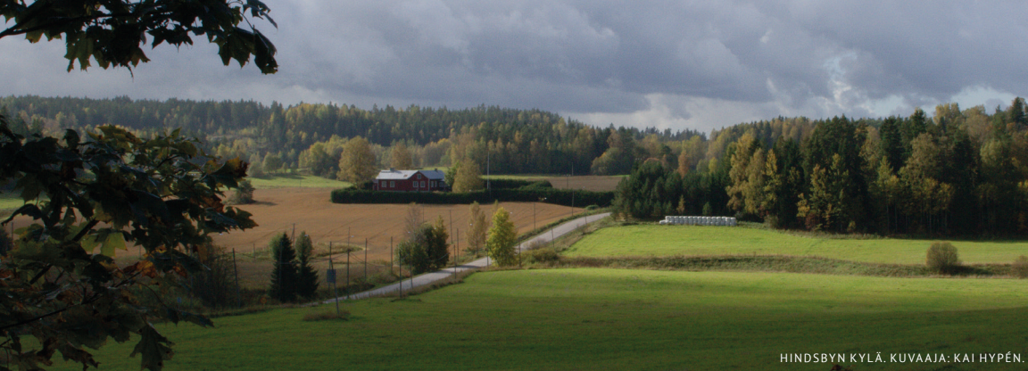
HINDSBYN KYLÄ.

f Sipoonkorven kansallispuisto - Sibbo Storskogs nationalpark ig @sipoonkorven_kansallispuisto ig @luontopalvelut, # luontopalvelut # sipoonkorvenkansallispuisto, # sibbostorskogsnationalpark, # sipoonkorpinalpark www.luontoon.fi/sipoonkorpi www.utinaturen.fi/sibbostorskog www.nationalparks.fi/sipoonkorpinp